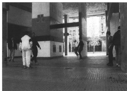
Galerie de l'Arlequin à la Villeneuve, Grenoble, 1998.

« On n'a pas de retour dans les quartiers ». Tel est le leitmotiv qui semble rythmer le discours des acteurs publics concernés par l'élaboration et la mise en œuvre des politiques sportives territoriales de l'agglomération