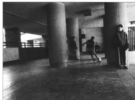
Football en pied d'immeuble.

Si les pratiques sportives spontanées sont rarement mentionnées par les jeunes (elles relèvent davantage, selon eux, des loisirs que du sport), les acteurs publics les situent, en retour, entre l'éducation populaire, la politique