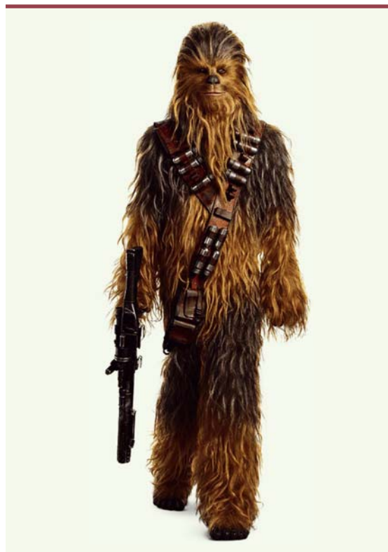
Figure 3. Chewbacca. Homme chimère.

L'heure actuelle, il est interdit de laisser se développer le fœtus au-delà du tiers de la gestation, ceci afin d'éviter la naissance d'animaux chimères homme/porc. Mais s'il est possible de générer des cœurs humanisés qu'il est possible de greffer, on peut penser que cette interdiction pourrait être remise en question, et Chewbacca ne serait plus alors de la science-fiction [26]. Mais est-ce qu'une chimère homme/animal serait une personne humaine ? À partir de quel pourcentage de cellules humaines doit-on parler de personne humaine ? Ou d'animal ?