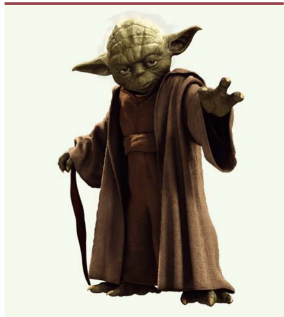
Figure 4. Homme transgénique.

Mais est-ce que le moratoire aurait la même essence si la modification génique amenait un réel avantage au bébé obtenu ? Est-ce qu'on se limiterait à soigner le bébé à naître sans s'intéresser aux générations suivantes ? On ne voudrait pas que les générations suivantes deviennent désavantagées. On voudrait que la modification se transmette à la descendance et que le gain obtenu par la manipulation génétique se perpétue dans des générations suivantes.