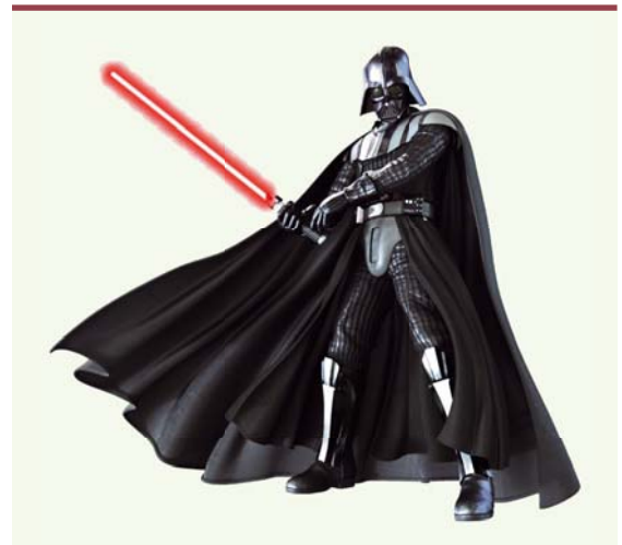
Figure 1. Dark Vader. Homme augmenté.

de la cellule adulte ayant permis l'obtention de l'iPS. Toutefois de très nombreuses équipes de recherche travaillent sur ce sujet [12].