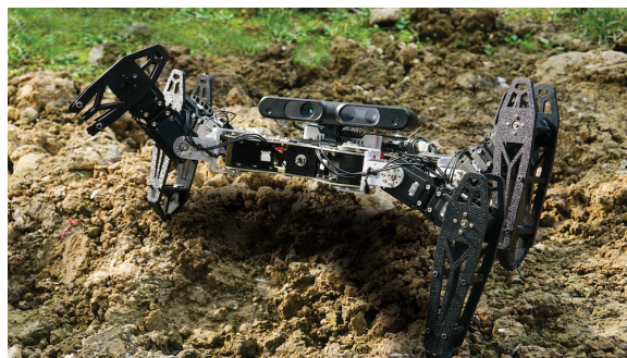
Figure 1 : Robot hexapode avec une patte brisée.

Dans cette thèse, nous proposons une approche différente qui consiste à laisser le robot apprendre de lui-même un nouveau comportement lui permettant de surmonter la situation rencontrée. Cependant, les méthodes actuelles d'apprentissage sont lentes même lorsque l'espace de recherche est petit et contraint. Pour surmonter cette limitation et permettre une adaptation rapide et créative, nous avons combiné la créativité des algorithmes évolutionnistes avec la rapidité des algorithmes de recherche de politique (policy search). La synergie qui en résulte a permis à des robots de s'adapter à des pannes mécaniques en seulement quelques minutes.