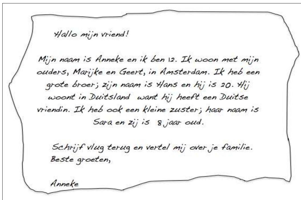
Figure 1 – Texte en néerlandais

Trois textes abordant des sujets habituellement travaillés en cours de langue furent soumis aux élèves. Les textes ont été proposés sans en indiquer la nature: nous avons ainsi cherché à neutraliser les effets des idées préconçues concernant les langues.