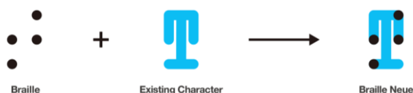
Figure 1: Lettre T en braille et en alphabet latin, puis superposées dans la police Braille Neue