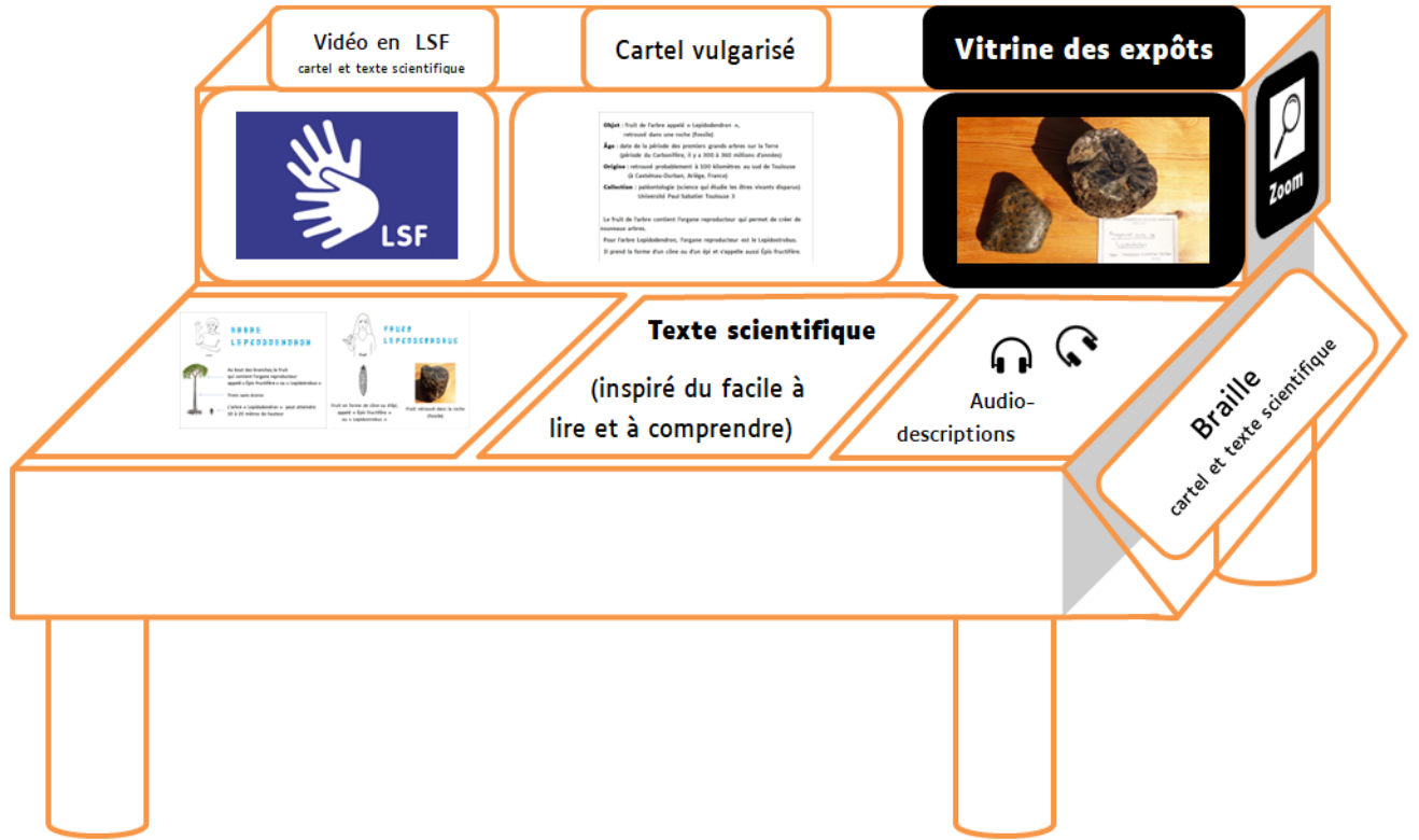
Figure 6: Maquette de cartel universel du Lepidostrobus