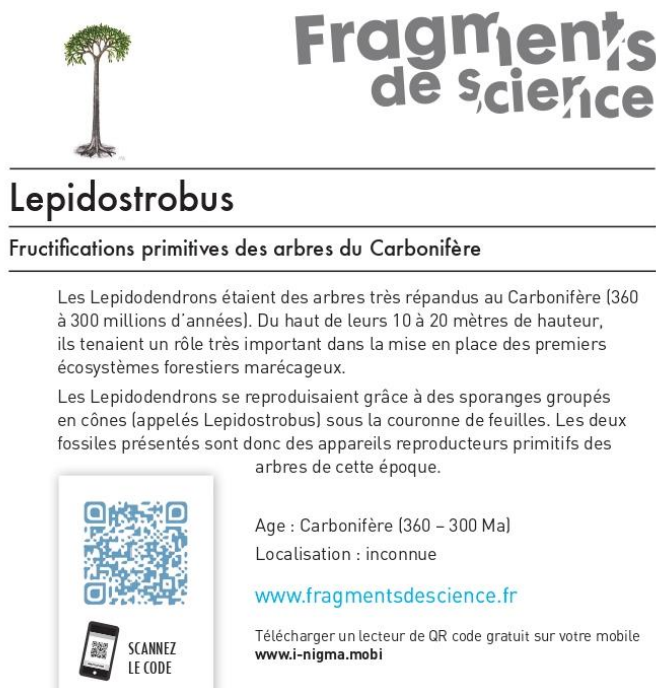
Figure 2: Cartel du Lepidostrobus, saison automne 2019-2020

La source : Equipe de Fragments de Science de l'UPS.