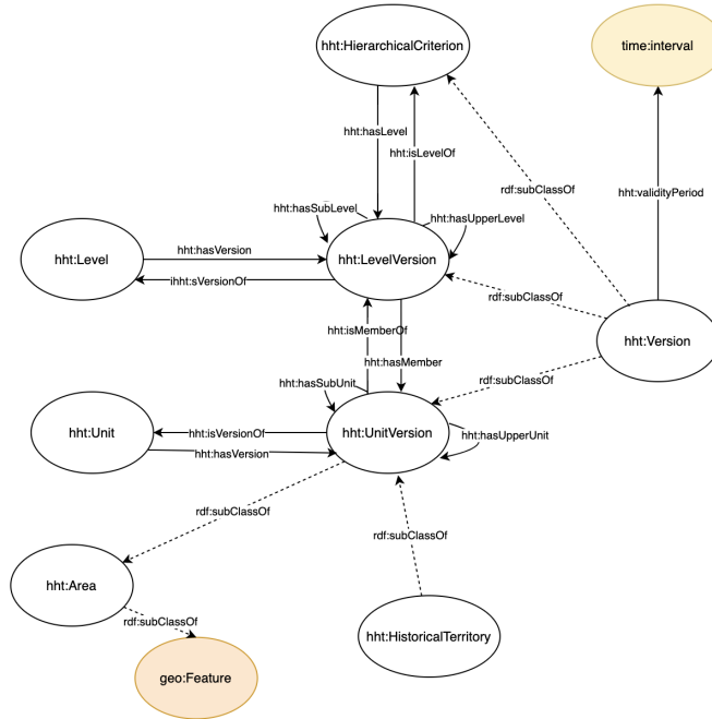
FIGURE 1 – Schéma de l'ontologie HHT