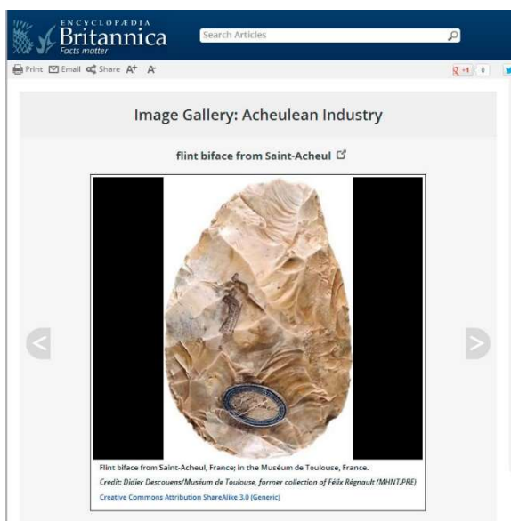
[À gauche] Biface de Saint Acheul

L'écueil de la liberté de télécharger réside dans l'impossibilité de référencer toutes les publications dans lesquelles des photographies des collections du muséum de Toulouse sont publiées. Parmi les publications scientifiques, on retrouve : American scientific (750 000 exemplaires en avril 2013), Encyclopedia Britannica , National Geographic , Nature ... Peu d'éditeurs envoient leurs publications au muséum pour y être conservées. Il n'est donc pas possible de systématiquement compléter les dossiers d'œuvres. La visibilité des collections et du fonds photographique du muséum de Toulouse est devenue très importante avec des répercussions difficilement évaluables. Aucune étude n'a été réalisée pour répertorier les publications, les documentaires et les expositions qui utilisent les clichés après le téléchargement des médias. Les chiffres des consultations ne peuvent pas être corrélés avec les projets de valorisation.