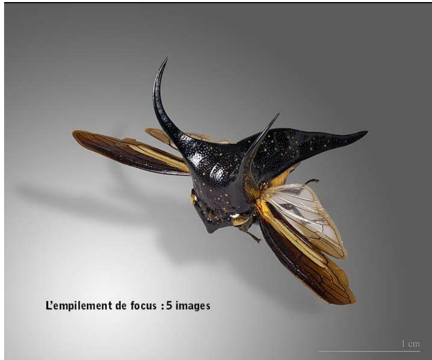
Hemikyptha marginata (Fabricius, 1781)

https://commons.wikimedia.org/wiki/File:Hemikyptha_marginata_MHNT_vol_perspective.jpg