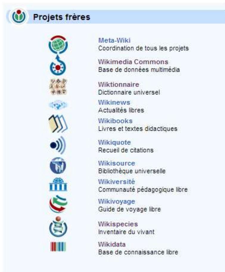
Liste de projets frères dans Wikimedia.

la bibliothèque municipale (2011) et le musée des Augustins (2012). La participation des institutions à Wikimedia permet l'intégration des projets Wikimedia dans les actions de diffusion de contenu et de vulgarisation avec un enrichissement des projets dans lesquels les professionnels de l'institution prennent leur part et valorisent leurs compétences spécifiques. En juin 2017, Wikipédia en français compte plus de 1 880 813 articles et 16 021 contributeurs enregistrés actifs. 23 000 000 d'images sont chargées dans Wikimedia.