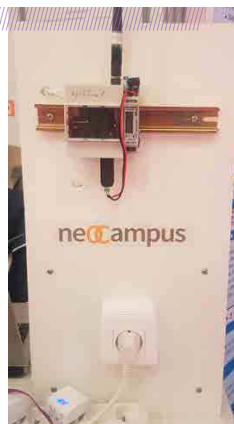
Figure 2. « Prototype d'un compteur électrique communicant longue distance (Technologie LoRa) ».

Le LAPLACE, spécialisé dans la conversion d'énergie, se focalise notamment sur les « micro-réseaux intelligents », clusters énergétiques (habitat intelligent, sites isolés...) aussi autonomes que possible énergétiquement et participant activement à la stabilisation du réseau. Par exemple, dans le projet Hyport, il s'agit de bâtir l'infrastructure énergétique des futurs aéroports intégrant massivement des sources renouvelables couplées à un électrolyseur d'hydrogène constituant un hub énergétique capable, non seulement de stocker les surplus de production, d'alimenter des usages électriques et une flotte de véhicules de transport et de servitudes, sans oublier l'hydrogène pour les aéroports du futur. Ceci nécessite une gestion optimisée « multi flux » puisqu'il s'agit de gérer électricité, gaz (hydrogène) et chaleur : on parle alors de co-génération. La