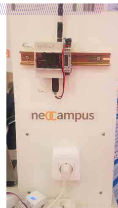
Figure 2. « Prototype d'un compteur électrique communicant longue distance (Technologie LoRa) ».

Le LAPLACE, spécialisé dans la conversion d'énergie, se focalise notamment sur les « micro-réseaux intelligents », clusters énergétiques (habitat intelligent, sites isolés...) aussi autonomes que possible énergétiquement et participant activement à la stabilisation du réseau. Par exemple, dans le projet Hyport, il s'agit de bâtir l'infrastructure énergétique des futurs aéroports intégrant massivement des sources renouvelables couplées à un électrolyseur d'hydrogène constituant un hub énergétique capable, non seulement de stocker les surplus de production, d'alimenter des usages électriques et une flotte de véhicules de transport et de servitudes, sans oublier l'hydrogène pour les aéroports du futur. Ceci nécessite une gestion optimisée « multi flux » puisqu'il s'agit de gérer électricité, gaz (hydrogène) et chaleur : on parle alors de co-génération. La