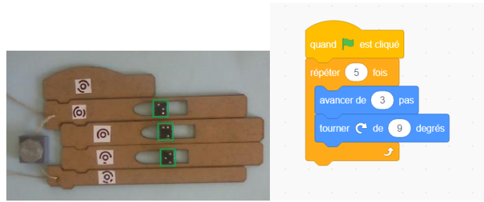
Figure 3 - Programme Scratch tangible et programme produit sur ordinateur

L'acceptation par les utilisateurs non-voyants d'un tel dispositif débranché a déjà été évaluée notamment par (Boissel, 2017). Notre proposition permet de les rendre autonomes par la génération et l'exécution automatique de leur programme.